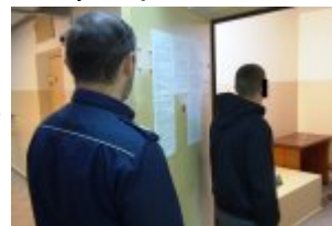
Policjant podczas czynności z podejrzanym o rozbój