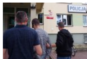
Policjanci podczas czynności z podejrzanym o rozbój i kradzież rozbójniczą

Za sam tylko rozbój, kodeks karny przewiduje do 12 lat pozbawienia wolności. Recydywiście grozi jeszcze wyższy wymiar