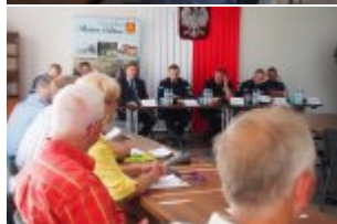
Debata społeczna w Urzędzie Gminy w Kołbieli