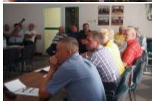
Debata społeczna w Urzędzie Gminy w Kołbieli