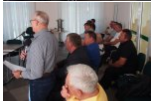
Debata społeczna w Urzędzie Gminy w Kołbieli