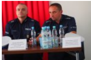
Debata społeczna w Urzędzie Gminy w Kołbieli