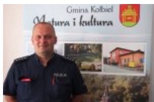
Debata społeczna w Urzędzie Gminy w Kołbieli