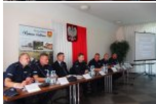
Debata społeczna w Urzędzie Gminy w Kołbieli