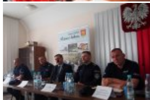
Debata społeczna w Urzędzie Gminy w Kołbieli