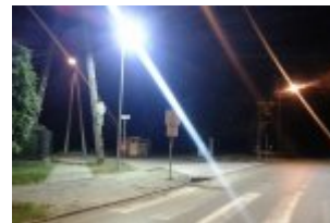
Dodatkowo doświetlone przejścia - widok w nocy (Otwock: ul. Wawerska i skrzyżowanie z ul. Szkolną)