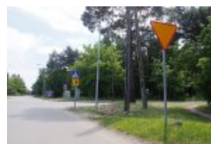
Dodatkowe latarnie w rejonie skrzyżowania ulic: Wawerskiej i Szkolnej w Otwocku