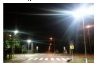
Dodatkowo doświetlone przejścia - widok w nocy (Otwock: ul. Wawerska i skrzyżowanie z ul. Szkolną)