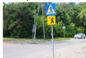
Dodatkowe latarnie w rejonie skrzyżowania ulic: Wawerskiej i Szkolnej w Otwocku