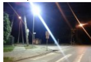
Dodatkowo doświetlone przejścia - widok w nocy (Otwock: ul. Wawerska i skrzyżowanie z ul. Szkolną)