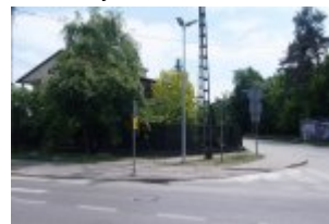
Dodatkowe latarnie w rejonie skrzyżowania ulic: Wawerskiej i Szkolnej w Otwocku